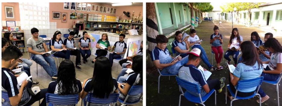
Figura 2 – Rodas de Leitura com os alunos do Terceiro Ano A - Manhã