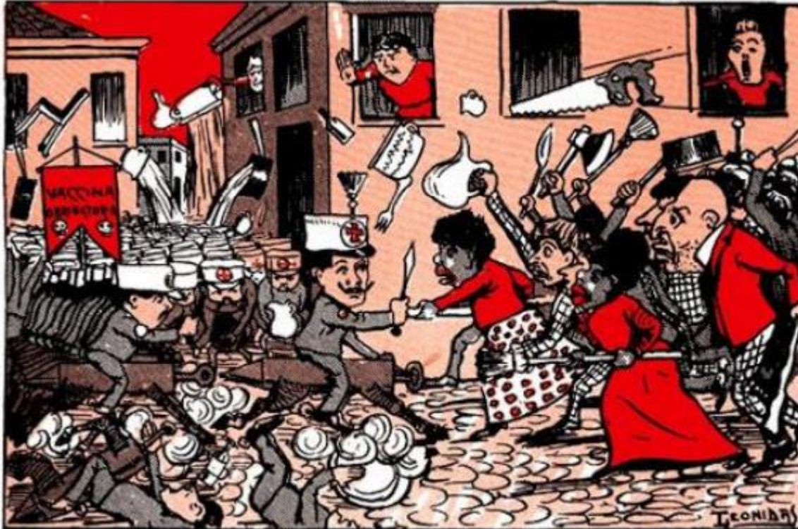
Charge capa da revista O Malho , de 1904.