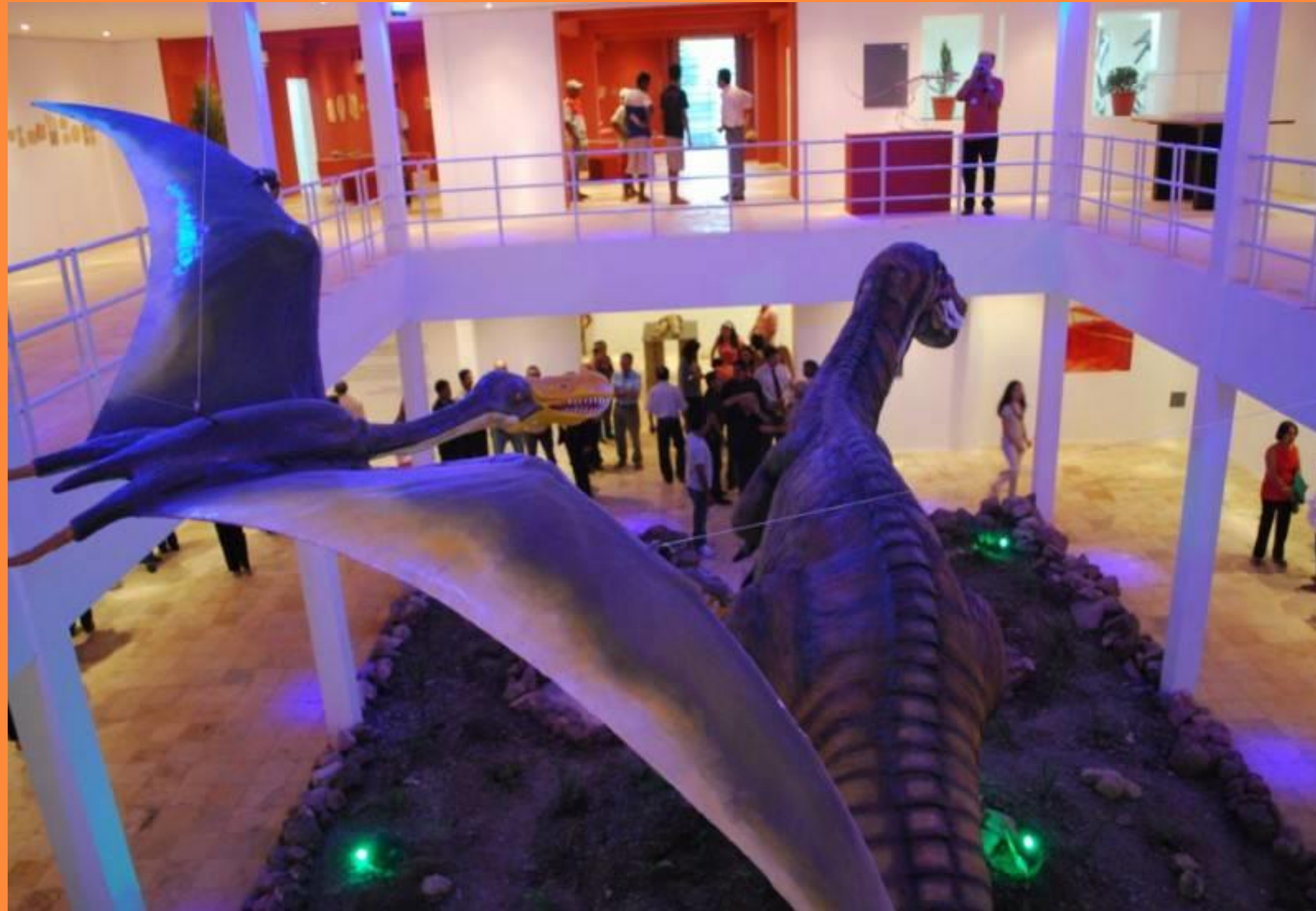
Museu de Paleontologia

A riqueza geológica e paleontológica da região no Cariri é única no mundo em diversidade e quantidade, tendo sido encontrados registros paleontológicos de mais de 100 milhões de anos. Pesquise sobre o Museu de Paleontologia do Cariri Cearense.