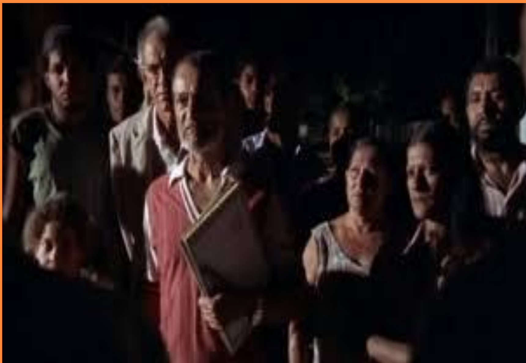
Imagem do Filme Narradores de Javé