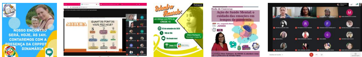
Figura 3: Registros dos Encontros com a CRPPDT e a Psicóloga.

Nessa perspectiva, foram promovidas rodas de conversa virtuais com a psicóloga da CREDE 15 e, também, com a Coordenadora Regional do Projeto Professor Diretor de Turma (CRPPDT), nas quais as duas deram ênfase ao cuidado com as emoções dos PDTs, e a algumas temáticas pertinentes para o ser humano e para o profissional. Outro destaque foi a formação sobre as práticas do PPDT, estabelecendo um paralelo entre o Conselho de Turma e as Competências Socioemocionais e, ao mesmo tempo, utilizando algumas ferramentas digitais como mentimeter e padlet , com o intuito de incentivá-los ao uso delas para mobilizar a participação dos alunos e como meio facilitador da interação aluno-tema-diretor de turma.