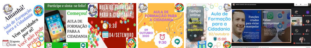
Figura 1 - Cards motivacionais para Aulas de FCDCSEs, 2020.

fortalecer a ação dos PDTs foi instituída a sistemática do Professor Padrinho de Turma – PPT com o objetivo de intensificar o trabalho em equipe e compartilhar as responsabilidades do Diretor de Turma. Também, são elaborados, semanalmente, pela Coordenadora Escolar do Projeto Professor Diretor de Turma (CEPPDT), posts diferenciados para a divulgação das aulas de Formação para a Cidadania e Desenvolvimento das Competências Socioemocionais (FCDCSEs) nas redes sociais.