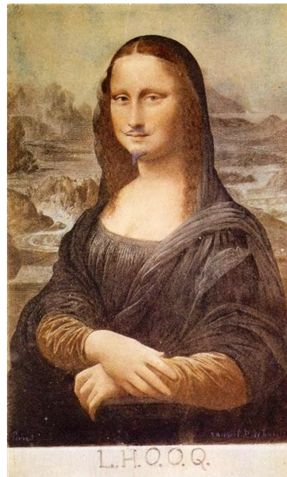
L.H.O.O.Q, Monalisa com bigode Marcel Duchamp (1919)