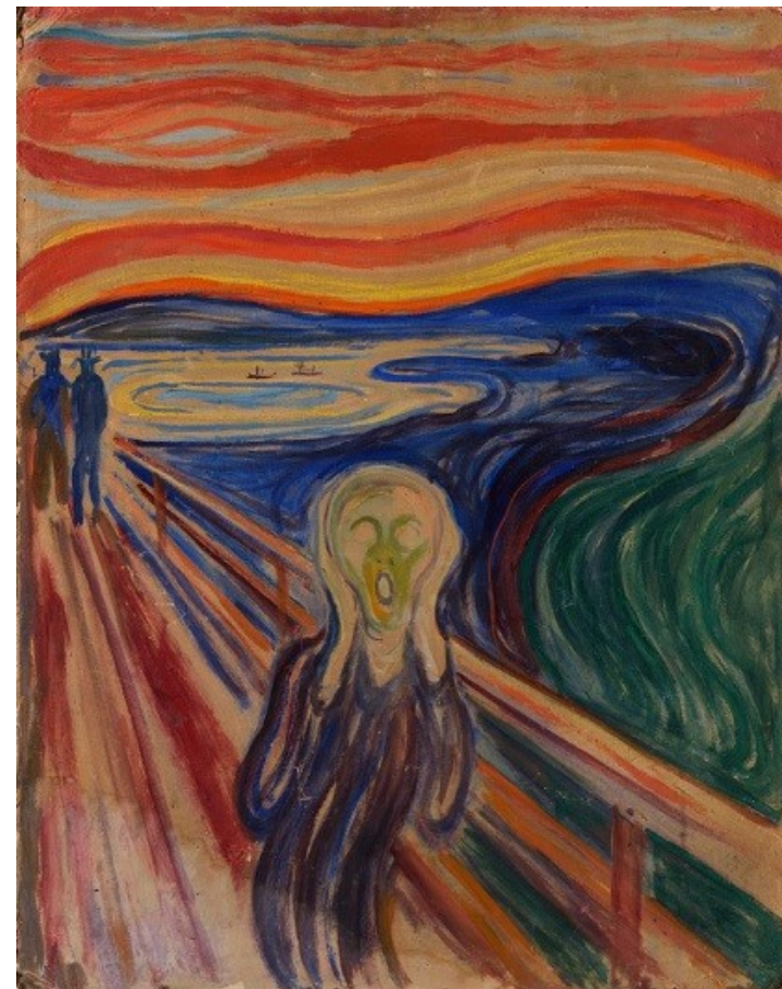
O Grito Edvard Munch (1893)

Disponível em: https://www.todoestudo.com.br/artes/expressionismo . Acesso em: 16 abr. 2020.