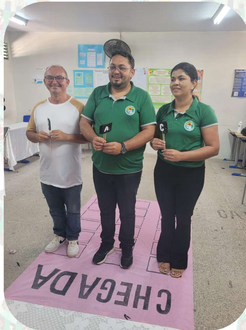
Salas de Jogos